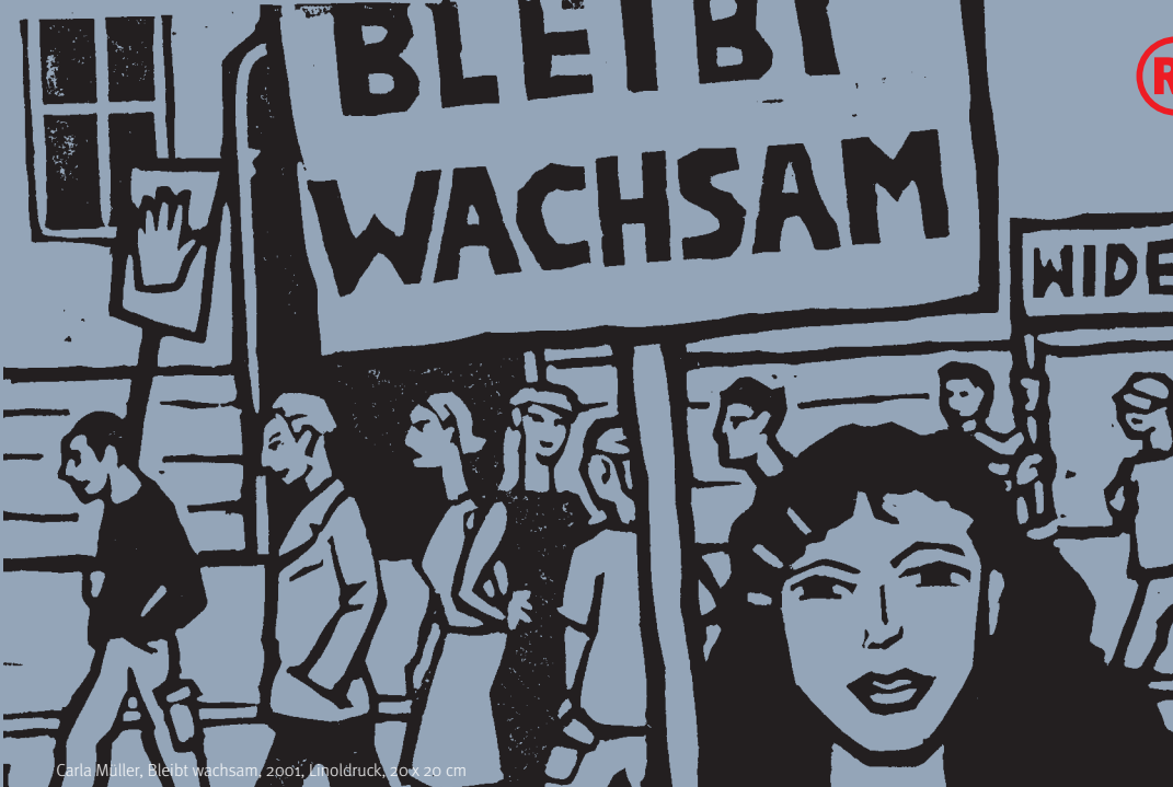
Carla Müller, Bleibt wachsam, 2001, Linoldruck, 20 x 20 cm